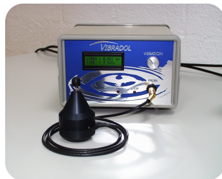
Simple d'utilisation, précis et performant !

Oui et avec succès ! La méthode de rééducation sensitive avec le Vibradol a été testée cliniquement et les effets en sont très concluants. Dans 89% des cas , les patients ayant suivi le traitement ont obtenu des résultats positifs.